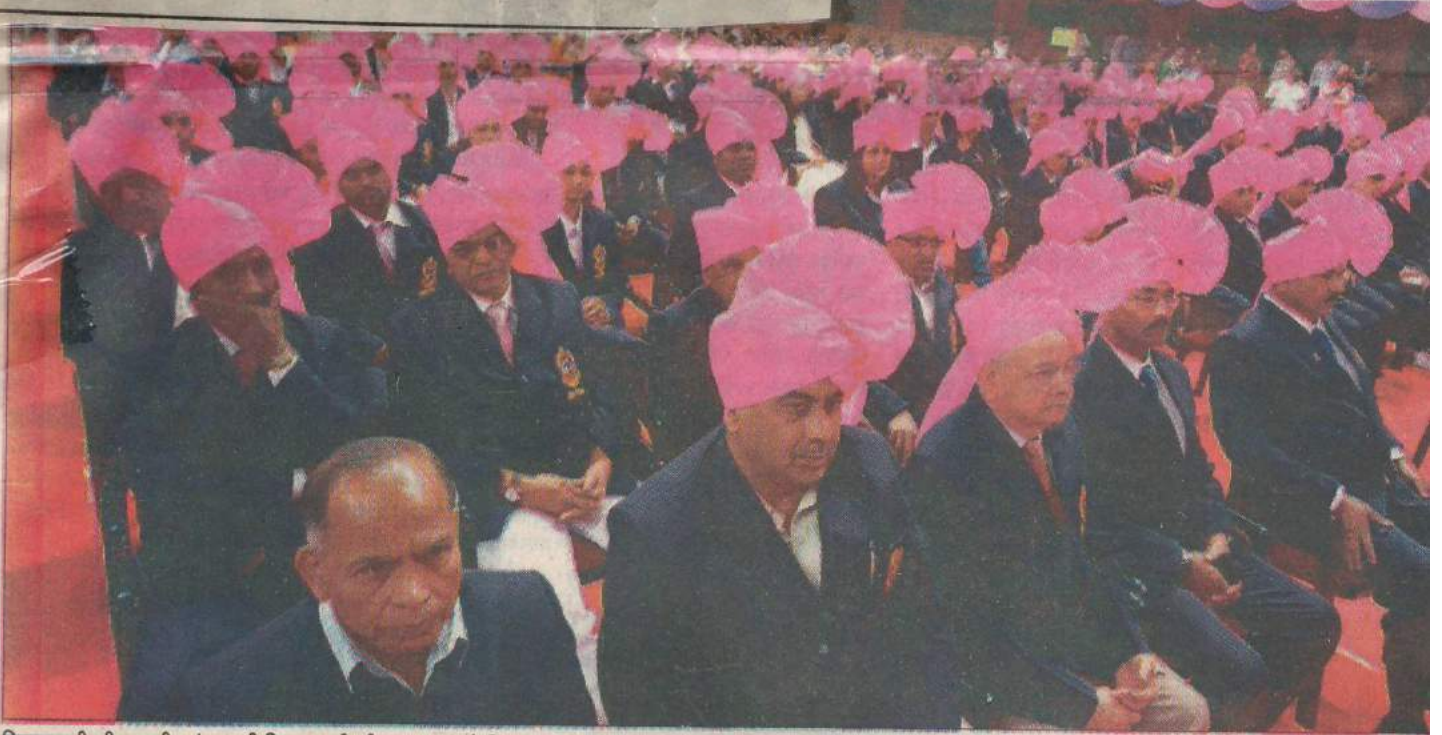
शिवछत्रपती क्रीडानगरीत मंगळवारी शिवछत्रपती क्रीडा पुरस्कारांचे वितरण करण्यात आले. त्या वेळी पुरस्कार वितरणाच्या प्रतीक्षेत पुरस्कारार्थी.