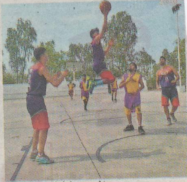
बास्केटबॉल स्पर्धेमध्ये खेळी करताना खेळाडू.

दुसरीकडे लोणावळ्याच्या इंडियन नेव्ही संघाने सेमीफायनलमध्ये