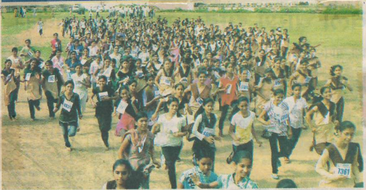
कन्नड : राष्ट्रीय क्रीडा दिनानिमित्त आयोजित मॅरेथॉन स्पर्धेत सहभागी झालेले विद्यार्थी.